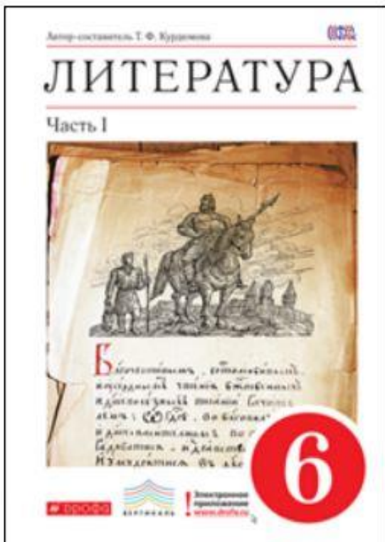
Литература. 6 класс. Часть 1