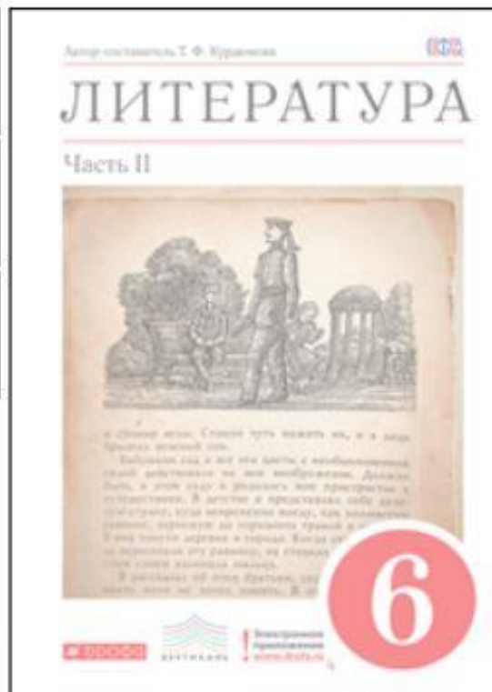
Литература. 6 класс. Часть 2